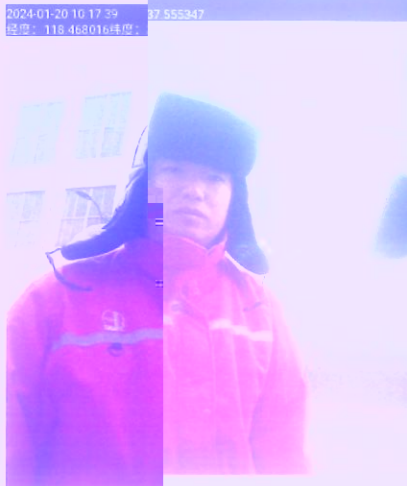
图 1 检测照片