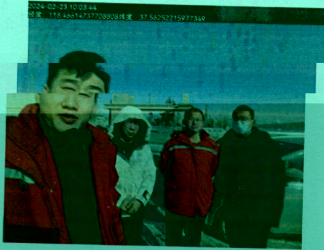
图 1 检测照片